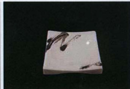
Tac-B-312 9.3×9.3×h1.7cm プラチナブラシ104モデル 800 円