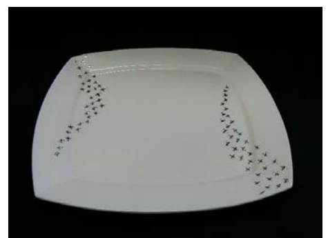
No.12 角のプレート天の川