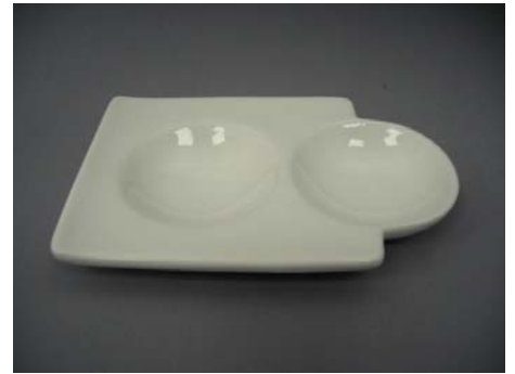
No.3 小皿 丸型ツピース