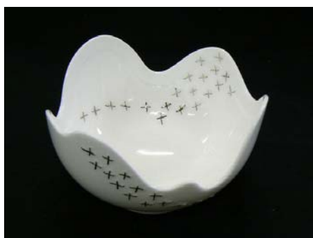
No.11 星切小鉢 天の川