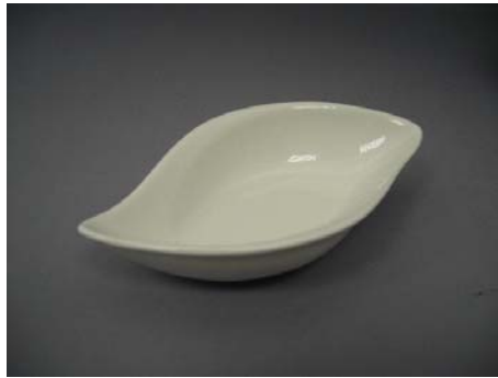
No.2 小鉢 リーフ型