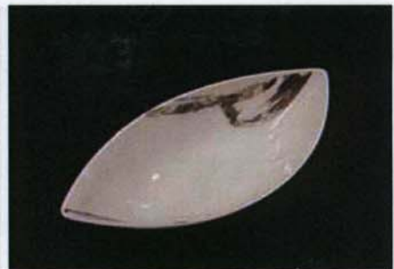
Tac-B-306 28.5×14.0×h7.5cm プラチナブラシシップモデル 3,700 円