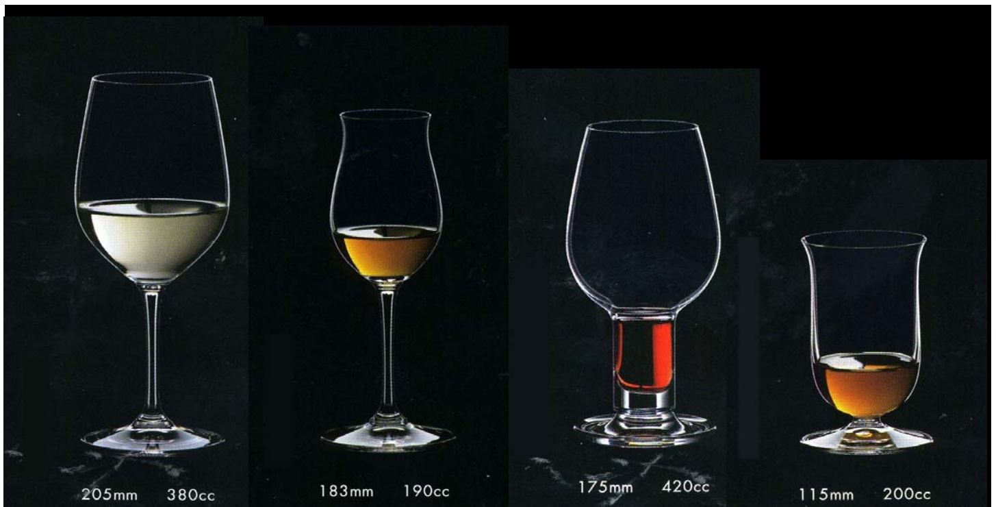
No.21 大吟醸 上代 3,500円