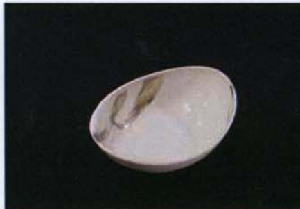
Tac-B-308 13.0×10.0×h4.5cm プラチナブラシパーティボール 1,100 円