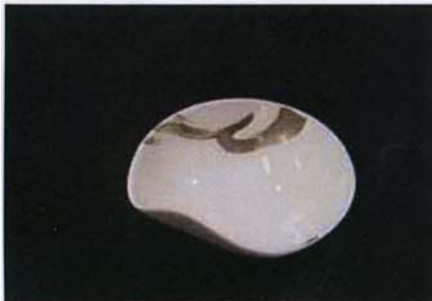
Tac-B-307 15.0×13.5×h5.5cm プラチナトリップボール 1,500 円