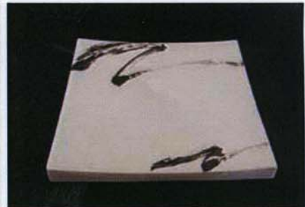
Tac-B-309 25.0×25.0×h3.0cm プラチナブラシ105モデル 3,800 円