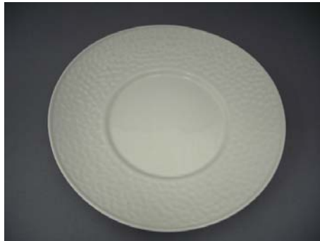
No.5 プレート インボスサークル