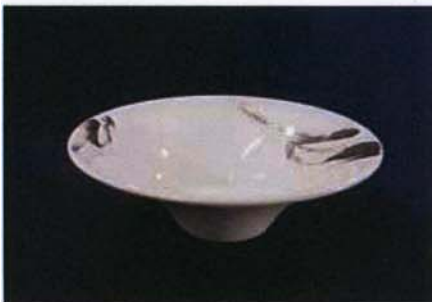
Tac-B-304 φ21.0×h7.5cm プラチナブラシフラワーモデル 2,600 円