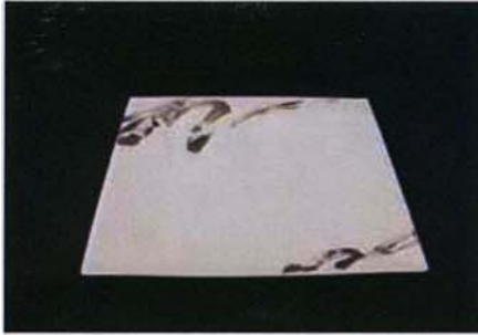
Tac-B-301 25.5×25.5×h2.8cm プラチナブラシ25cmスクエア 3,900 円