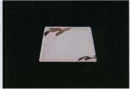
Tac-B-303 13.0×13.0×h1.5cm プラチナブラシ13cmスクエア 1,100 円