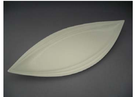
No.6 プレート リーフ型