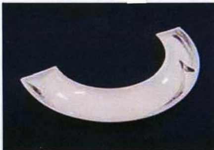
Tac-B-310 33.5×6.5cm プラチナブラシ101モデル 3,000 円