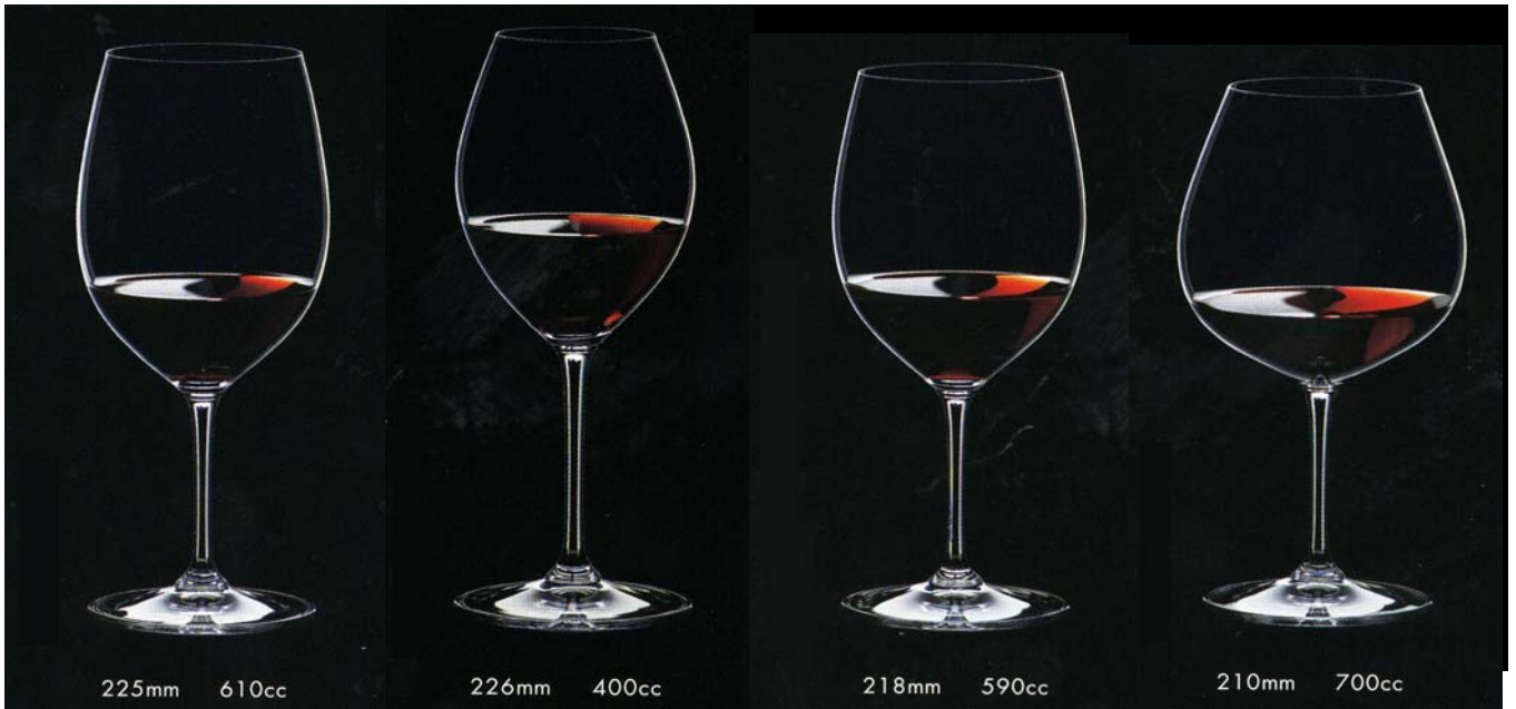
No.9 ボルドー 上代 3,300円