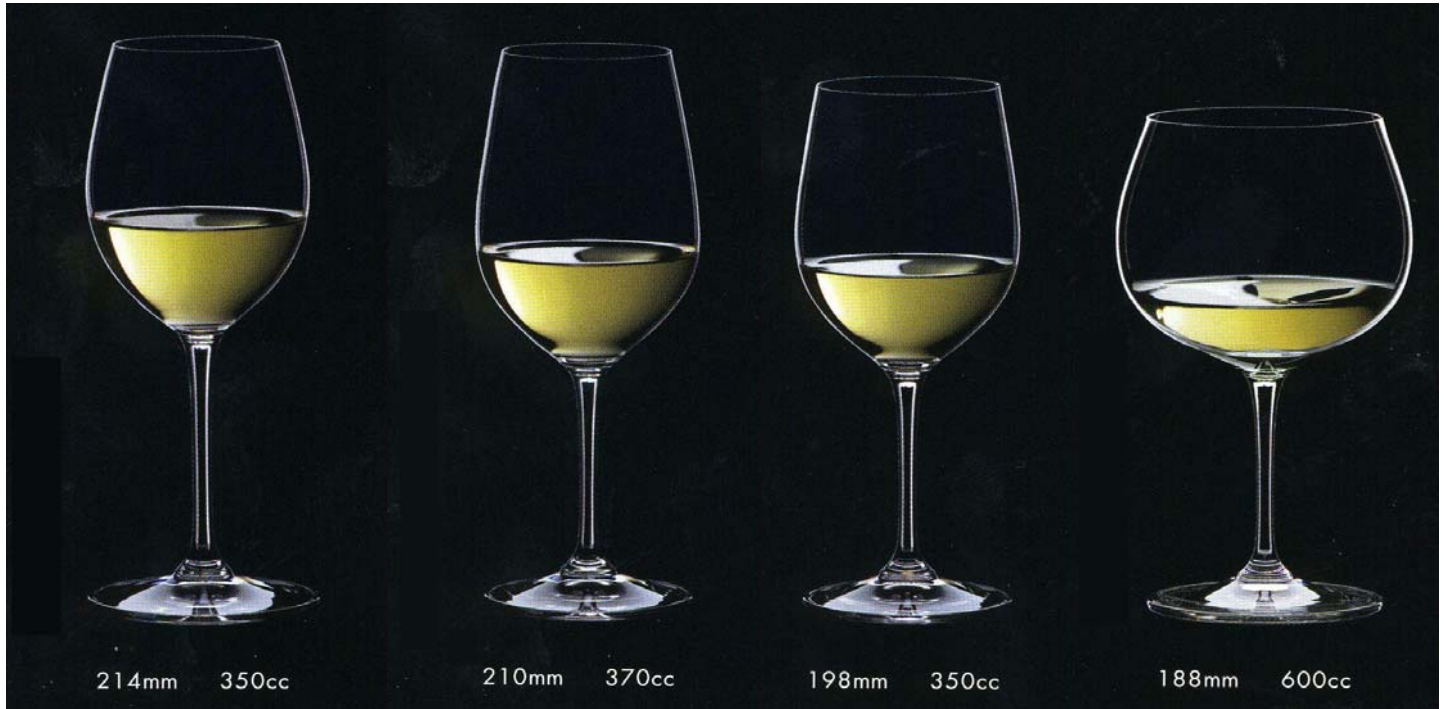
No.17 ソーヴィニヨン・ブラン 上代 3,000円