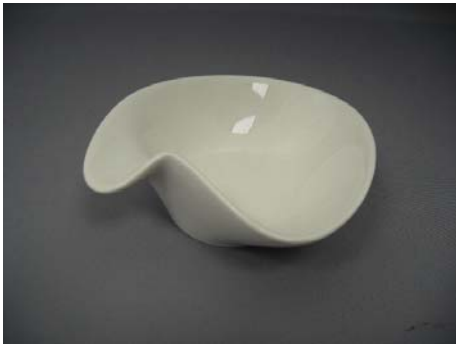
No.1 小鉢 手付き変型