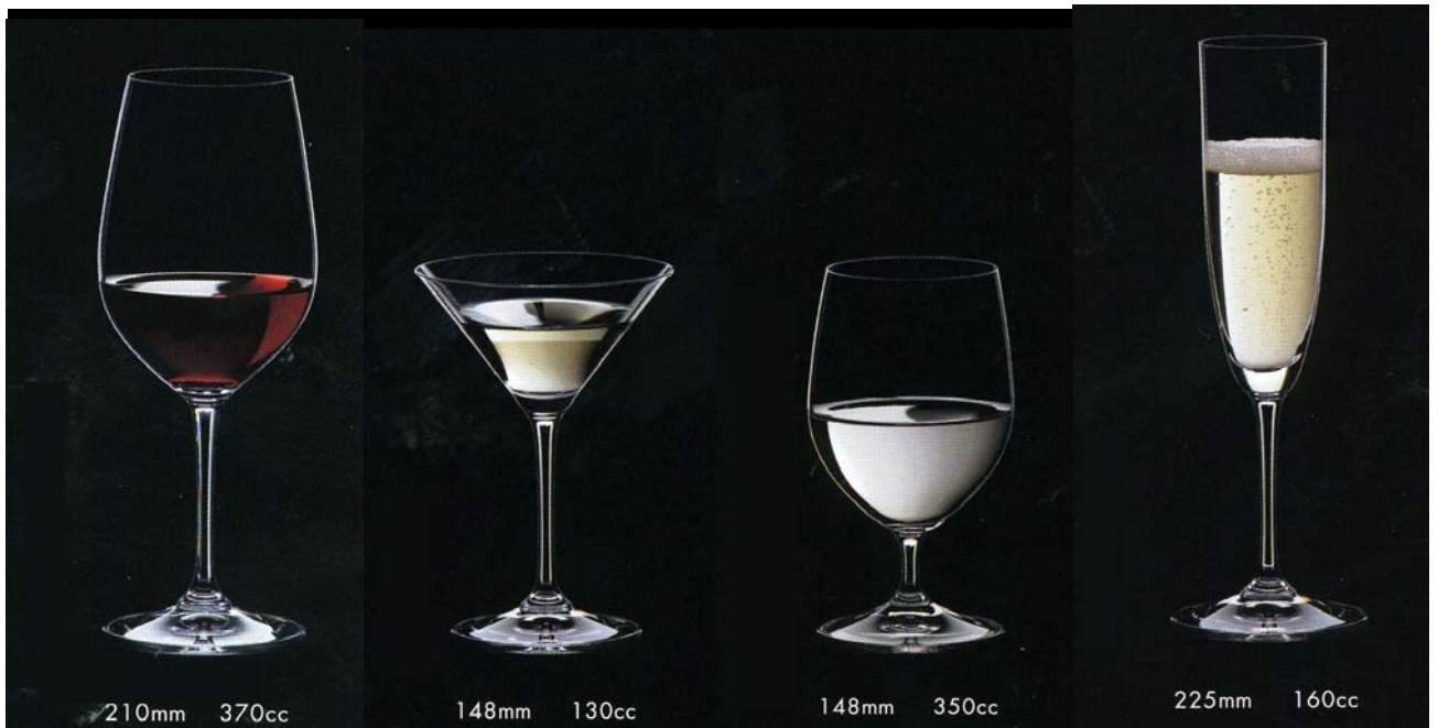
No.13 キャンティ・クラッシコ 上代 2,800円