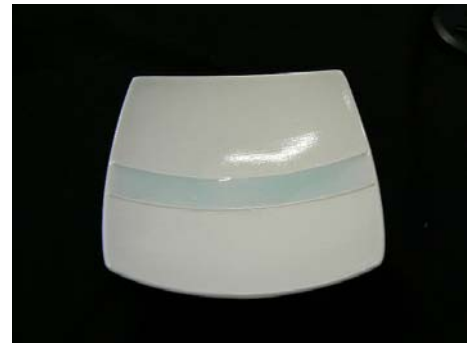
No.9 白磁青白流小正角皿