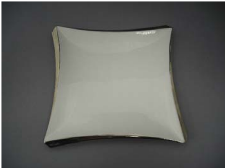
No.4 プレート 四角