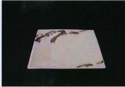
Tac-B-302 18.0×18.0×h2.7cm プラチナブラシ18cmスクエア 1,900 円