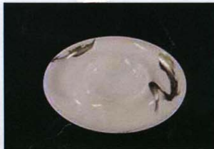
Tac-B-311 φ19.3×h2.0cm プラチナブラシ102モデル 1,600 円