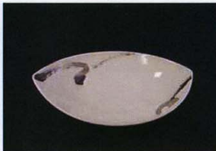
Tac-B-305 25.5×19.0cm プラチナブラシリーフモデル 3,200 円