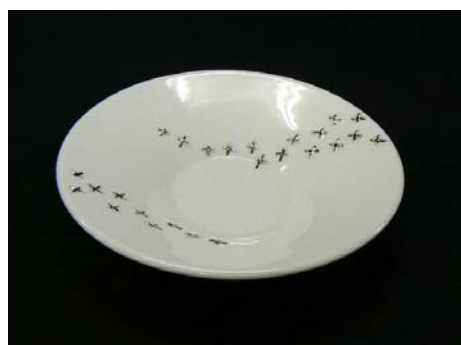
No.10 五寸反中付天の川