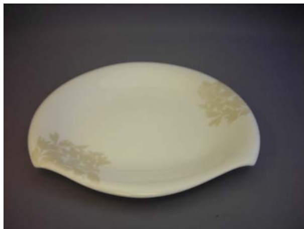
No.4 掬返皿白金彩つた