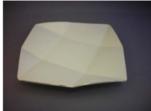
No.4 白アラチ八角折紙