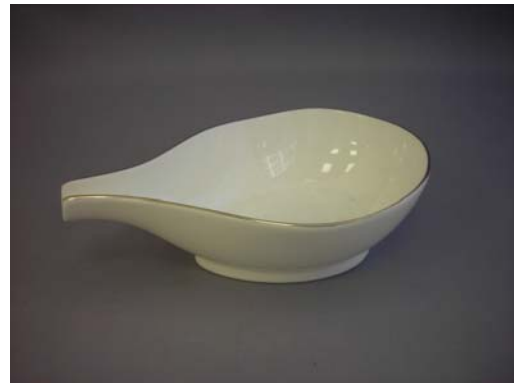
No.6 淵アヲチ片口小丼