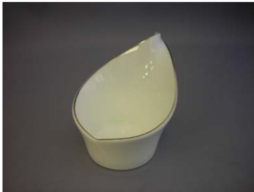
No.5 白淵アヲチ水芭蕉小付