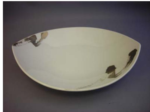
No.6 プラチナラチシリーズモデル