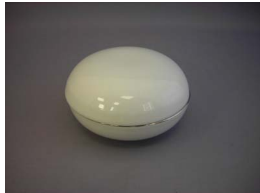
No.4 平ホール淵アヲチ