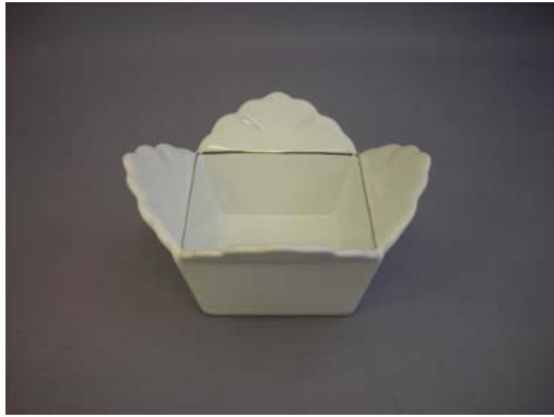
No.1 フォルス角珍珠シルク初付