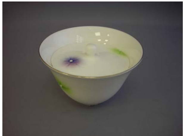
No.6 湯碗反蓋物白花リ