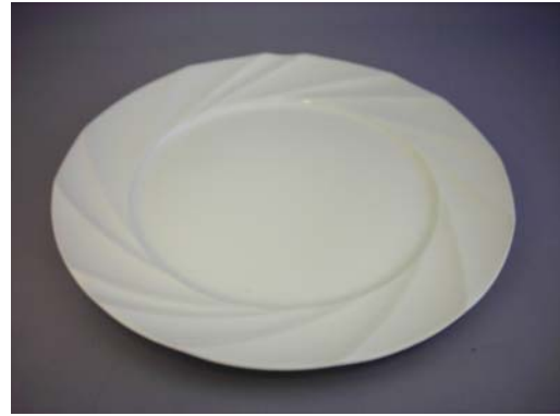
No.2 ミルクホワイト切子