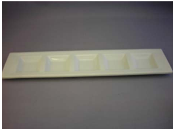
No.1 五品盛 (小) 太白