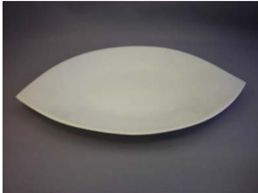
No.3 葉型皿ホワイト大