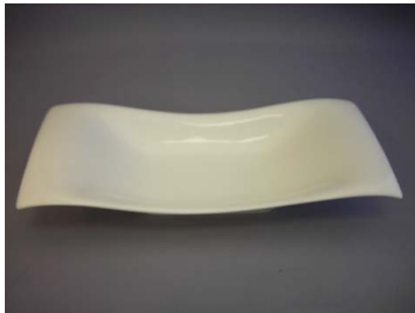
No.2 杓付両下り長角向付