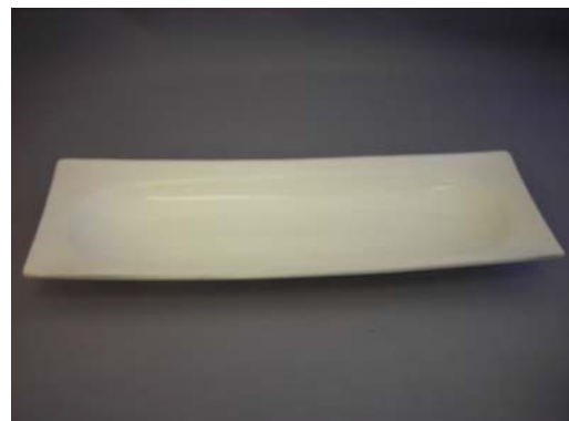
No.8 丸内角皿白滑アラチ