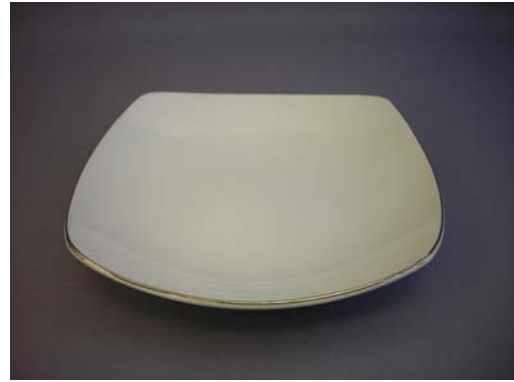
No.2 淵アヲチ四方正角皿