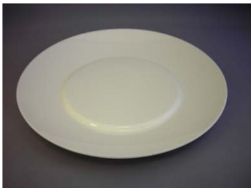
No.7 ホワイト内盛八寸皿