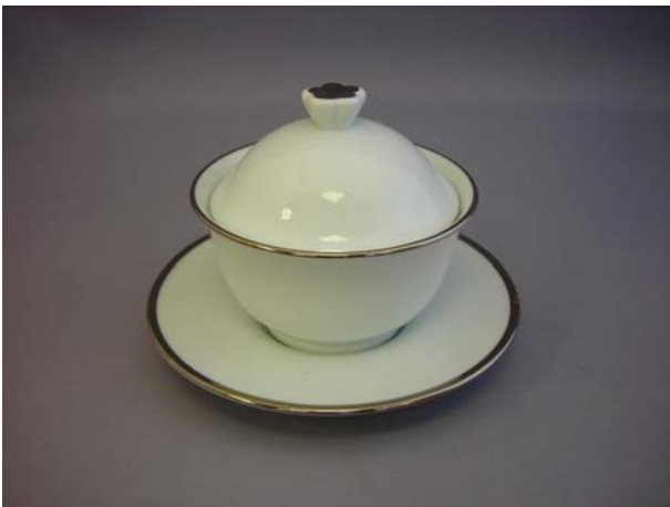
No.5 太白高台花文鉢付