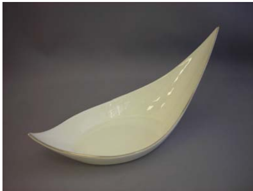
No.5 滑アラチ舟型向付