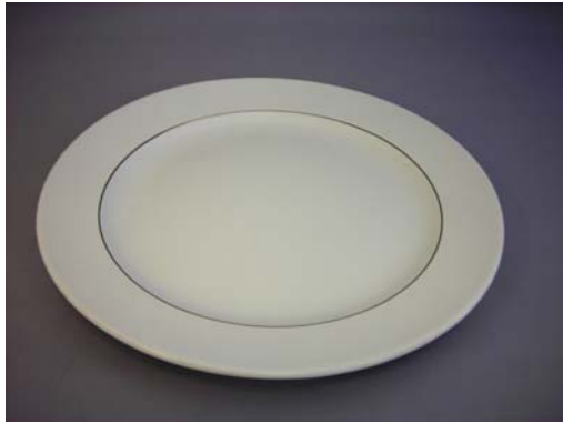
No.1 9インチプレートシルクホワイト