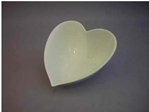
No.3 切り落としハート皿